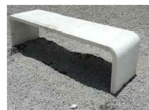
Detalhamento Bancos de Concreto Pré-Moldado