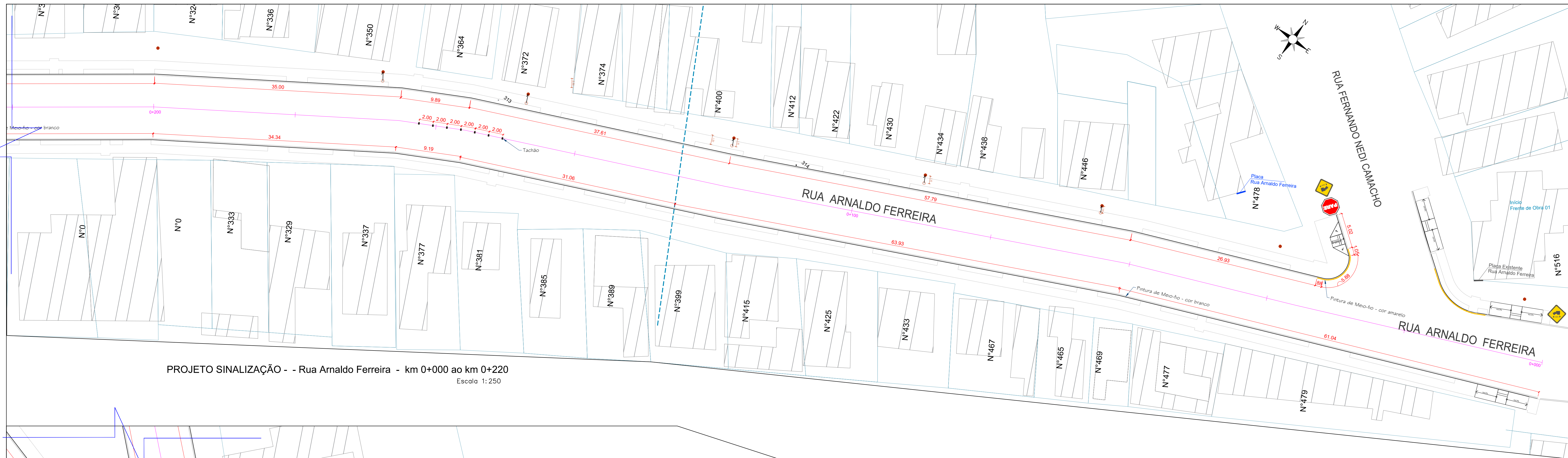
PROJETO SINALIZAÇÃO - - Rua Arnaldo Ferreira - km 0+000 ao km 0+220 Escala 1:250