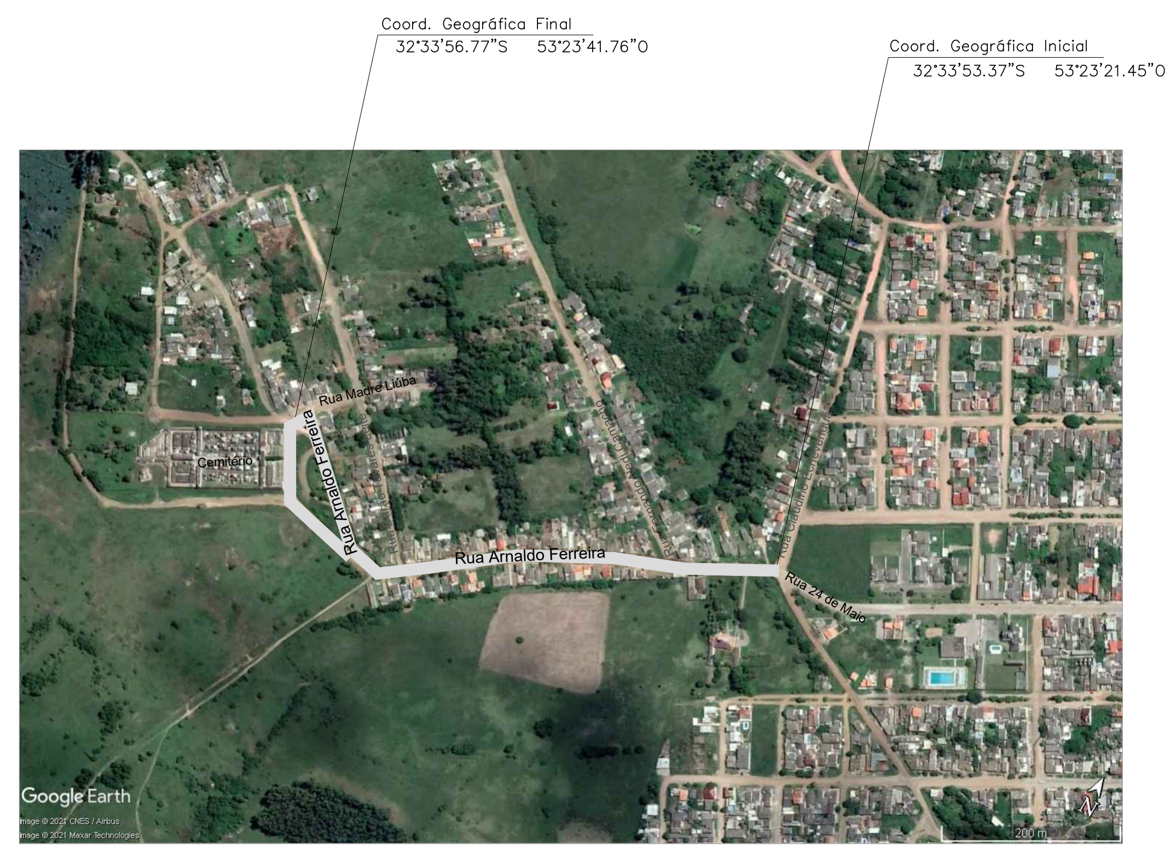
IMAGEM DE SATÉLITE Sem Escala