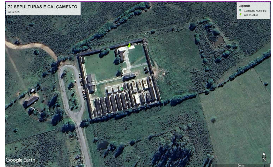
PLANTA LOCALIZAÇÃO - Cemitério Municipal de Jaguarão/RS S/ Escala