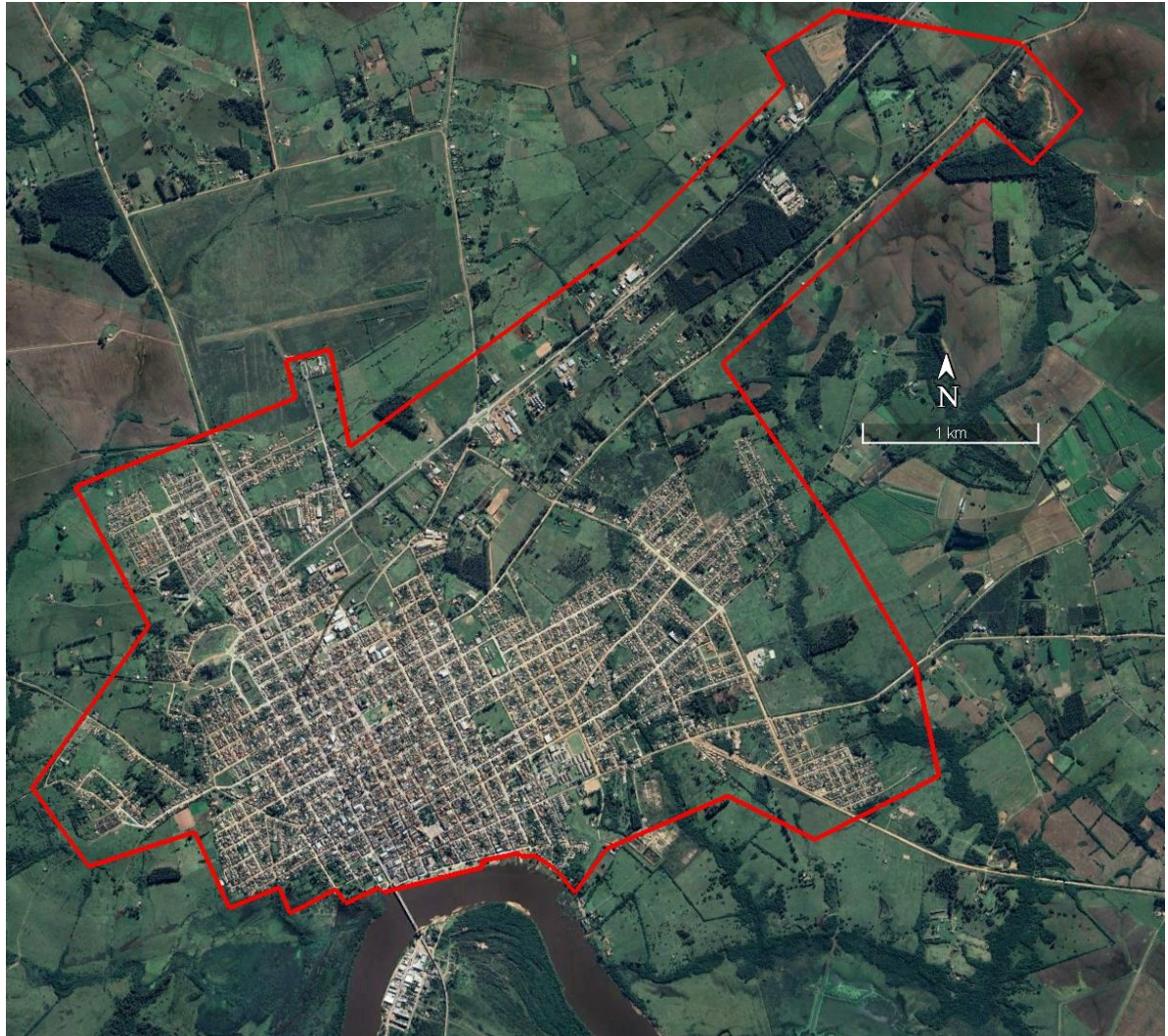
Área do perímetro urbano a ser levantado.