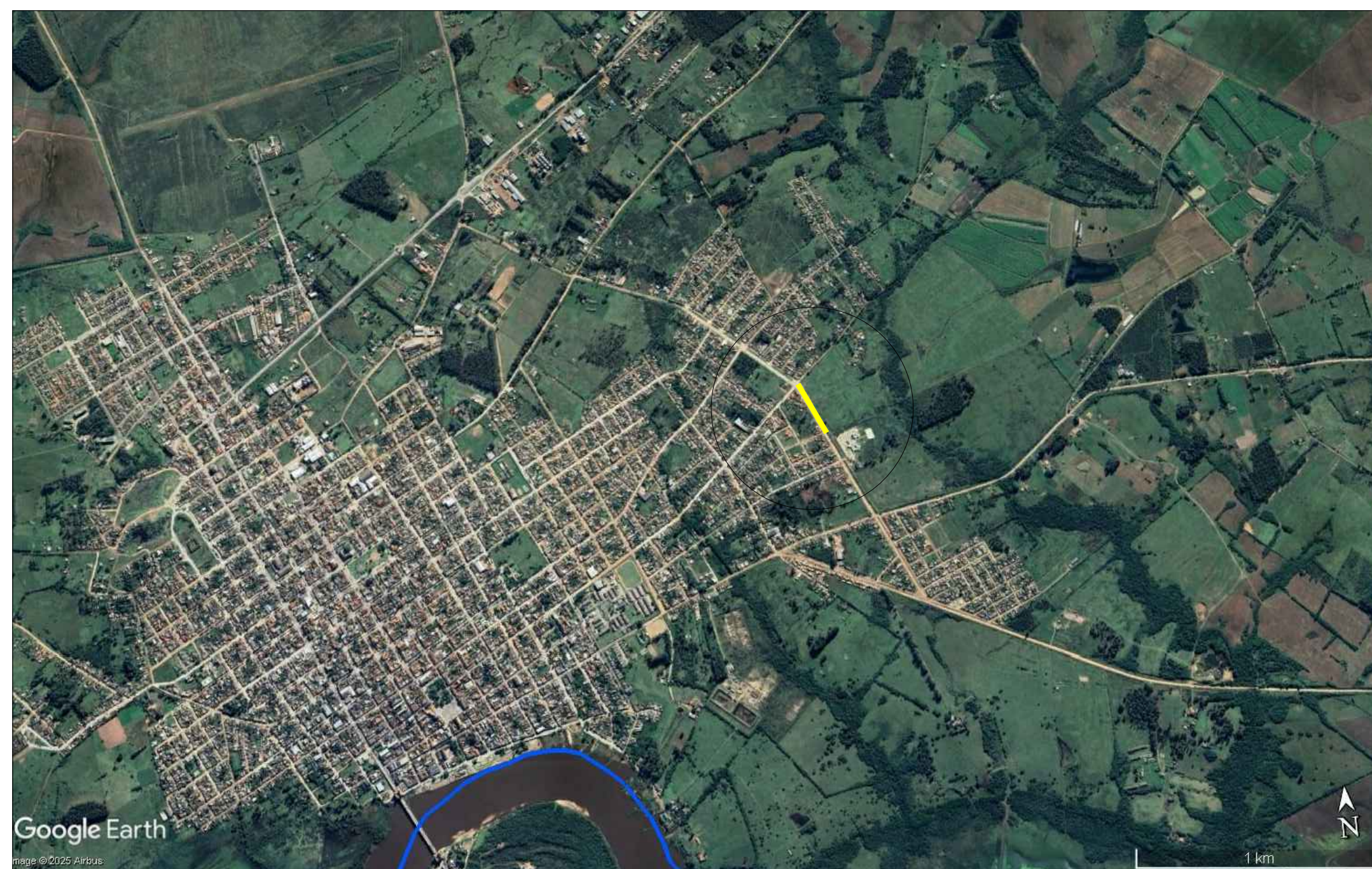
IMAGEM DE SATÉLITE Sem Escala