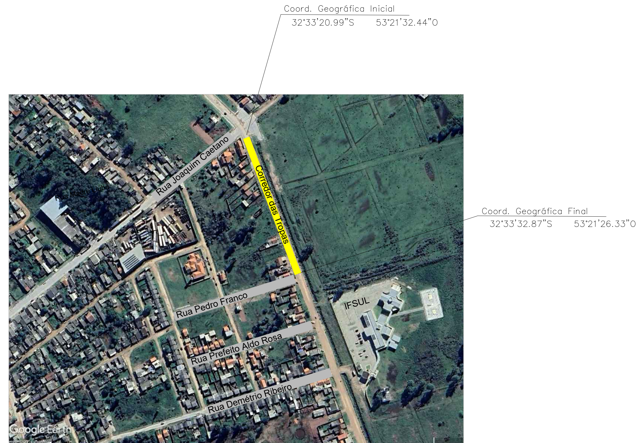
IMAGEM DE SATÉLITE Sem Escala