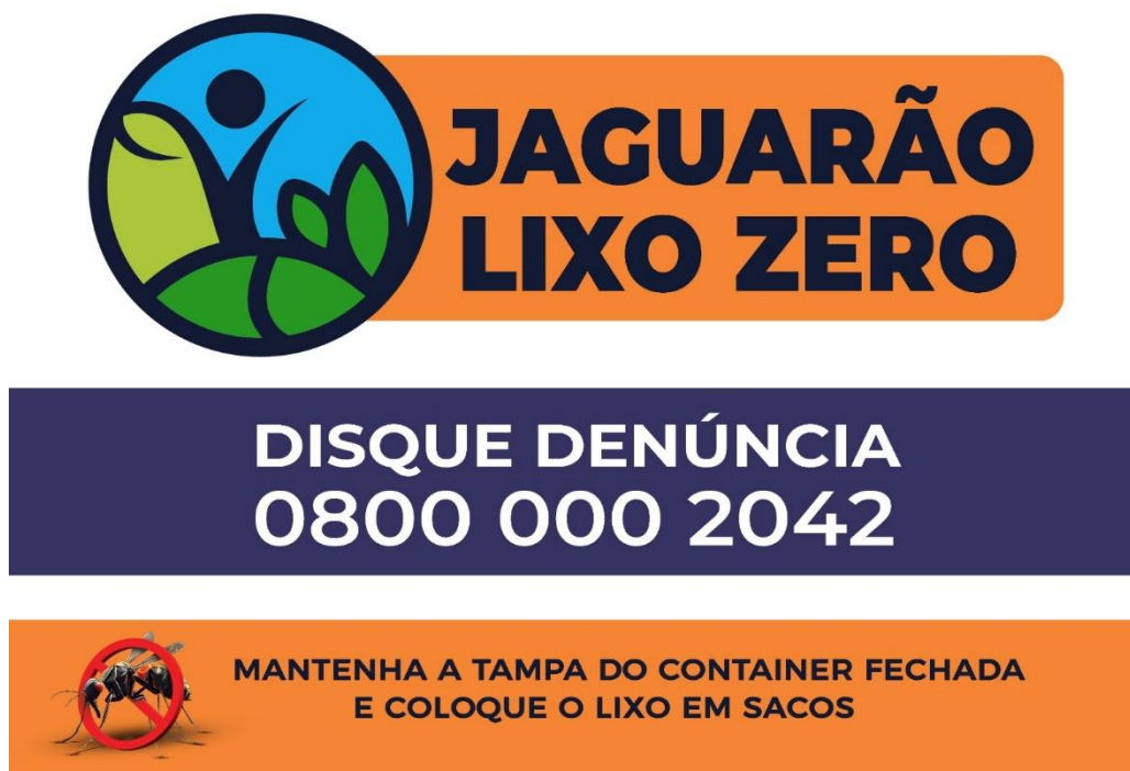
Figura 2. Arte a ser utilizada na impressão dos adesivos que serão afixados em ambas as laterais do equipamento, deverá ser confeccionado nas dimensões 60cm x 60cm.

Prefeitura Municipal de Jaguarão Avenida 27 de Janeiro, 422 CEP 96300-000 - Jaguarão/RS Fone 53.3261.1999